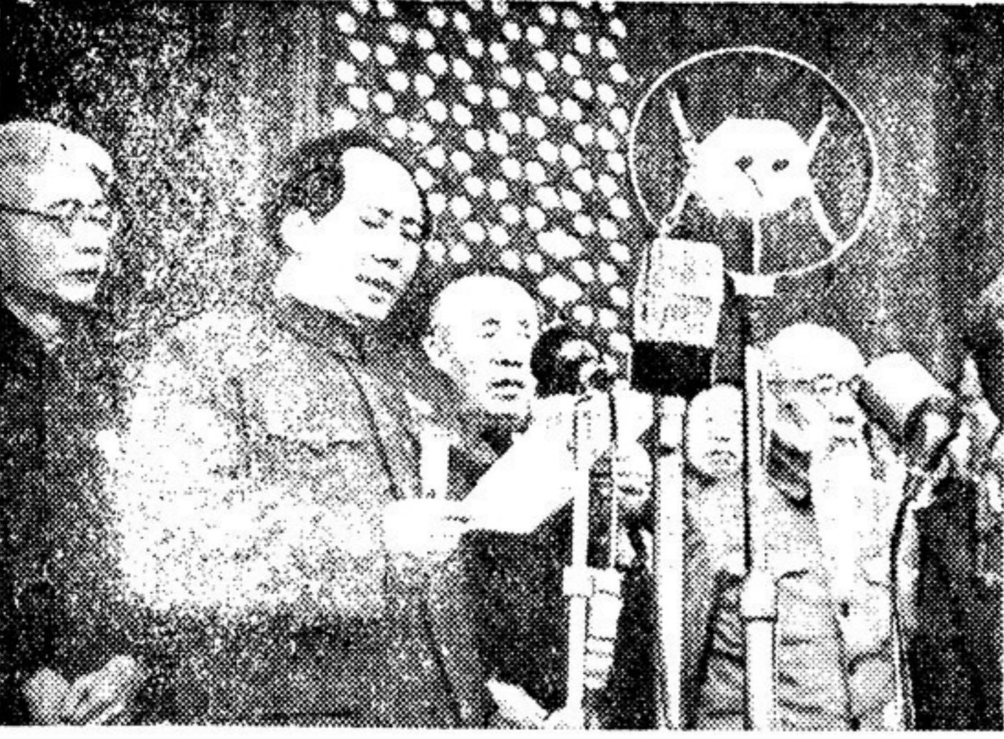
Вождь китайского народа Мао Цзе-дун произносит речь на параде в честь провозглашения Китайской народной республики.